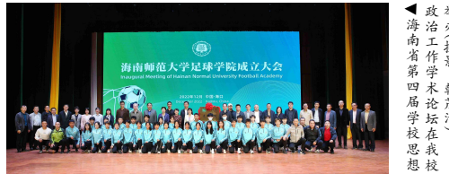
▲政治工作学术论坛在我校海南省第四届学校思政

本报讯(宣传部)风清气爽,阳光灿烂,海南师范大学校园内彩旗招展、人头攒动,一片热闹喜庆的景象。在第46个世界足球日来临之际,正值“世界杯”进行得如火如荼期间,12月9日上午,我校在桂林洋校区大学生活动中心隆重举行足球学院成立大会。建设海南师范大学足球学院是深入学习贯彻习近平总书记关于足球改革发展的重要指示精神,落实孙春兰副总理考察琼中女足时指示要求的重要举措,是海南省首个高校足球学院。