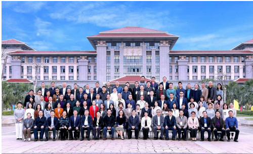
▲论坛在我校举办

本报讯(宣传部)为切实以习近平新时代中国特色社会主义思想指导新时代学校思想政治工作,推动党的二十精神进思政,12月12日,海南省第四届学校思想政治工作学术论坛在海南师范大学桂林洋校区图书馆举办。