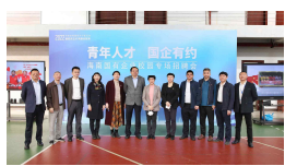
▲“青年人才 国企有约”海南国有企业校园专场招聘会在我校举行(摄影:韩茂清)

厅、省教育厅、省委人才发展局主办,我校联合海南省人力资源开发局(省就业局)、海南人才集团有限公司承办。中国铁建重工、中电研究院、中国移动、三亚航空旅游职业学院等94家中央驻琼企业、省属国有企业及各类学校参加,提供了涵盖财务、工程师、中小学教师等毕业生对口就业岗位1765个。我校及其他8所本省高校2000多名应届毕业生参加,初步达成签约和实习意向1000多人。 我校在招聘会现场设有“彩虹人生”简历问诊咨询处,为毕业生做职业指导、简历优化服务;海南青年人才就业服务站(海南师范大学站)在现场设置“政策宣讲”处,帮助毕业生