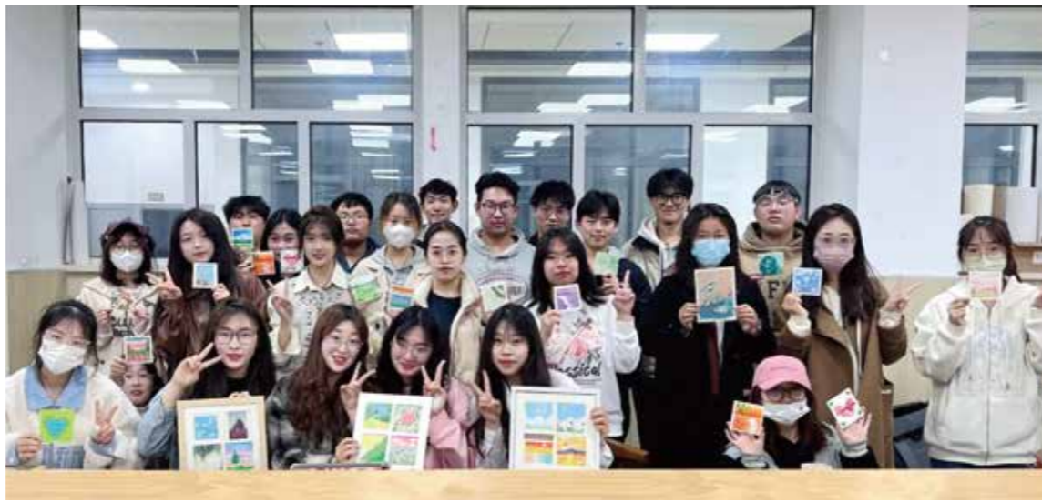
艺术学院插图2201班合影

春天是桃花盛开的山坡 是柳树随风摇曳的河畔 是翩翩起舞的蝴蝶 在细嫩的花瓣间穿梭 春光作序，万物和鸣 时光缱绻的画册 每一页都有温柔的清风和数不尽的繁花 娇嫩的鲜花竞相开放 伴着绵绵春雨 艺术学院插图2201班的全体同学举行 “约‘绘’美好共赴一场春意之约” 绘画活动 感受春天的春和景明 用手中的画笔画出 “我”心中的春天