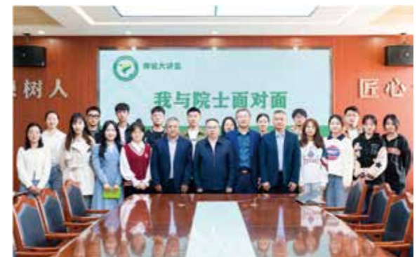
单杨院士与食品学子面对面畅谈「科研人生」