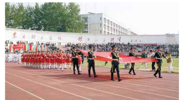
学校举办第45届田径运动会