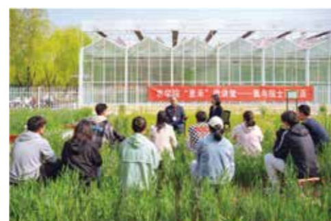
赵振东院士与农学院青年学子交流互动