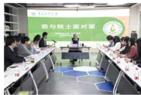
南志标院士与草业学院本科生座谈交流