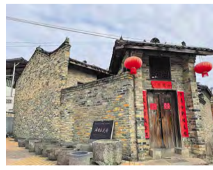
图为“银”村“正”兴团队实地走访石围古村