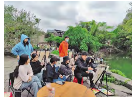
图为“美育艺行”大学生实践团现场写生、绘制墙绘

行是知之始，知是行之成，师大学子在知行合一中锻炼自己，扎根基层服务群众，用实际行动贡献青春力量，彰显时代青年的精神面貌与实践担当。习近平总书记在党的二十大报告中强调，“广大青年要坚定不移听党话、跟党走，怀抱梦想又脚踏实地，敢想敢为又善作善成。”踏上实现中华民族伟大复兴的新征程，需要千千万万有理想、有担当、重实干的青年人投身于社会实践之中，踔厉奋发，勇毅前行，以青春之热情追逐梦想，在实践中绽放绚丽之花。