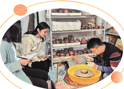
图为古城“陶”宝团队与非遗工艺传承人的合影