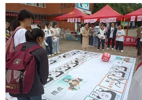
本报讯 在第35个国际禁毒日来临之际,昆