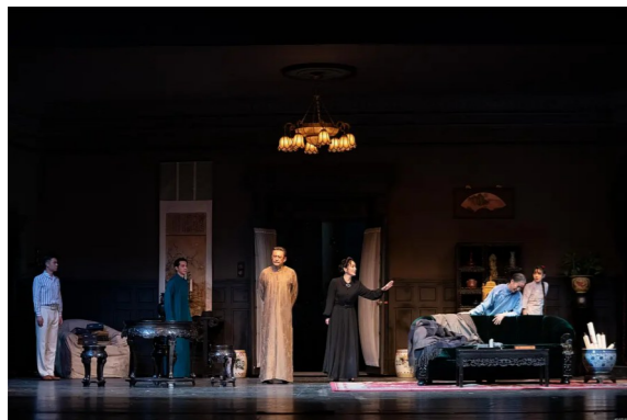
(图片为北京人艺话剧《雷雨》剧照)

高悬的明月淹没在重重黑云之下,猖獗的夜风叫嚣着席卷温暖人间。黄沙弥漫,迷住曹禺的眼鼻,他却不以意为意,保持着下蹲的姿势,于废墟之中挖掘着生活的真相。《雷雨》这部作品以曹禺先生发酵的情绪喷薄出他对中国家庭、社会、礼教的非谤,发泄着被压抑的愤懑。他用一种悲悯的心情来写剧中人物的争执,用一个罪恶的家庭的覆灭、一个悲剧为我们展现了人性的罪大恶极、蛮性的遗留,天地间的残酷和人世间的冷漠。一阵雷雨呼啸而过,一场悲剧随即而生。