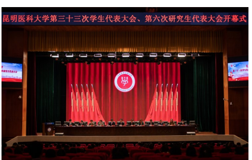
昆明医科大学第三十三次学生代表大会、第六次研究生代表大会开幕式

示祝贺,对昆明医科大学学生会、研究生会的工作表示肯定,并提出3点要求:一是加强思想引领,补足精神之钙,积极引导广大同学听党话、跟党走;二是牢记服务宗旨,践行初心使命,切实发挥好桥梁和纽带作用;三是坚持从严治会,加强作风建设,打造清朗阳光的学生会组织。