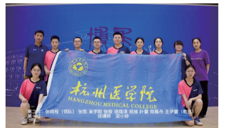
(文/徐靖婷 凌哲琦 摄/郑雁丹)

6月29日至7月3日,浙江省第十六届大学生运动会乒乓球(甲丙组)比赛在浙江工业大学(莫干山校区)拉开序幕,我省47所高校600多名运动员进行7个项目的角逐,杭州医学院代表队创历史最好成绩。在男团赛事中,杭州医学院参赛队员力拼浙大,一举夺冠。男单存济口腔医学院徐瑞泽获得第八名,男双检验医学院、生物工程学院张凯和康复学院张松斩获第五名。杭州医学院获得体育道德风尚奖。王伊蕾老师获得“优秀教练员”称号,祝维、张松获得“优秀运动员”称号。