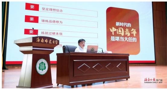
▲冯飞在我校进行宣讲

本报讯（海南省政府网）根据中央安排和省党委统一部署，11月14日，省委副书记、省长冯飞前往我校桂林洋校区，为我校师生宣讲党的二十大精神。