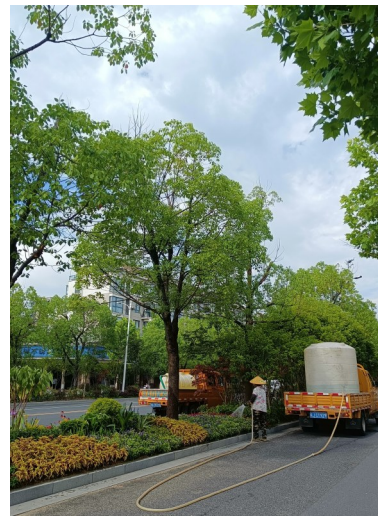
城市美容师