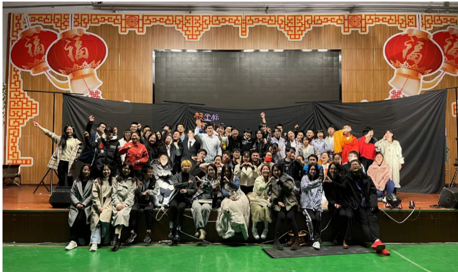
刚刚结束精彩演出的极·坐标话剧团团员欢聚在一起。

华电校园里,存在着一个这样的社团:这里有古灵精怪奇思妙想的人,有办事靠谱令人放心的人,有愿意陪你一起将快乐进行到底的人,有心思细腻留心生活的人……今天就让我们一起走近这个五彩斑斓的社团——极·坐标话剧团。