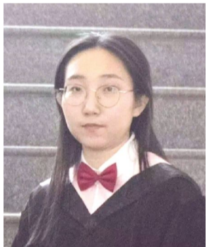
本报记者 杨柳 崔鸿博

“只要愿意不懈努力,机会就会招手,未来充满无限可能。”杨佳秉持如此信念,用努力与汗水筑梦,屡屡收获国家励志奖学金、校一等奖学金、校三好学生等奖励和荣誉,把大学生活写成诗,通向远方的光芒。