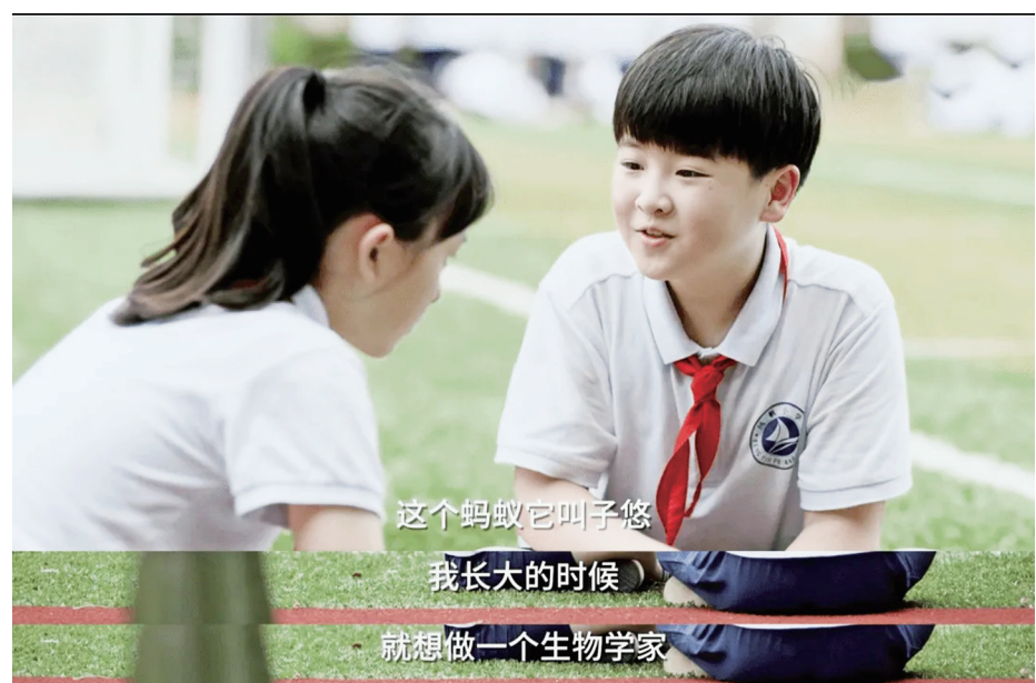
这个蚂蚁它叫子悠 我长大的时候 就想做一个生物学家

述带着安德烈去看台湾“精英幼儿园”的情景。园长说“我们有识字课、美术、音乐、体育、算术，还有英文……早上三节课，每一节四十五分钟。”这岂不是正规小学了吗？龙应台开始担心起来，在安德烈德国的幼稚班上，小朋友像蜜蜂一样，这儿一群，那儿一串，玩厌了积木玩拼图，玩厌了拼图玩汽车，房间里头钻来钻去的小人儿，像蜜蜂在花丛里忙碌穿梭，没有一个定点。“在德国的幼稚园里，孩子们只有一件事，就是玩、玩、玩。”不同国家的教育何以天壤之差，文化渊源、发展历程、社会环境……种种因素都会聚沙成塔而影响一个国家的教育现状。我们都期待一个更轻松、更有益于孩子成长、于未来更有希望的教育出现，也坚信这种教育一定会出现。